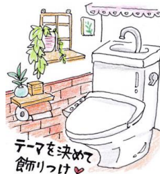
テーマを決めて飾り付け♡

フェイクのグリーンでワンランクアップ。多肉植物や垂れ下がるアイビーなどのグリーンがおすすめです。